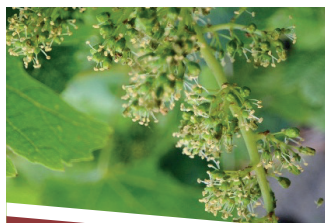
MALBEC ANTI COULURE