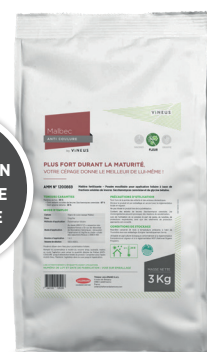
1 sac de 3 kg