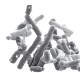
Bacillus amyloliquefaciens souche IT45