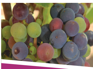
SYRAH ANTI BLOCAGE