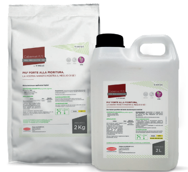
1 sacchetto da 2 kg + 1 tanica da 2 L