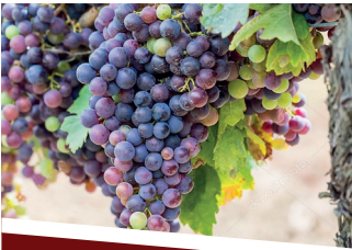
CABERNET F/S PRO PRECOCITÀ