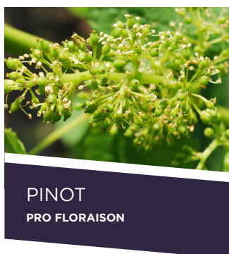
PINOT PRO FLORAISON