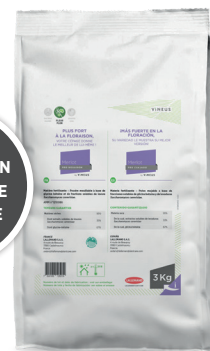
1 sac de 3 kg