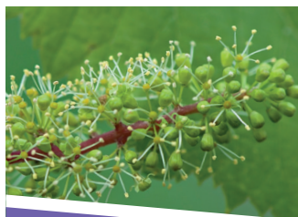
MERLOT PRO NOUAISON