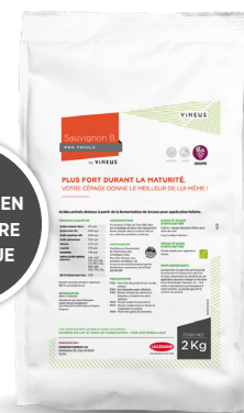
Sachet de 2 kg (1 ha)