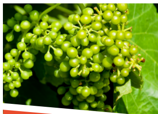
SAUVIGNON B. PRO THIOLS

➤ Active et accélère la synthèse et l'accumulation dans la baie des composés du métabolisme secondaire (polyphénols, précurseurs aromatiques dont thiols et terpènes)